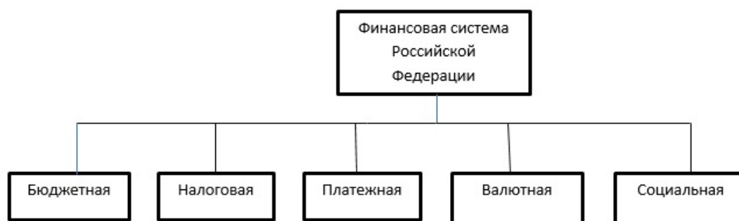
Рис.1 Подсистемы финансовой системы Российской Федерации

Такой подход позволяет показать, что финансовую систему страны можно представить из нескольких подсистем (рис.1).