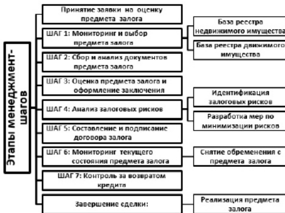
Схема 1. Этапы формирования залогового портфеля коммерческими организациями и управления им.

Как следует из данных, приведённых на схеме 1, процесс управления залоговым портфелем коммерческих организаций состоит из последовательных семи менеджмент-шагов, наиболее существенными из которых являются: анализ залоговых рисков, маркетинговый мониторинг текущего состояния залога и изменения его стоимости в условиях волатильности российского залогового рынка, экономический расчет и управление суммами возврата залогового кредита и т.д. Одновременно, вышеописанные семь менеджмент-шагов требовали, в свою очередь, системного осуществления коммерческой фирмой – залогодателем соответствующих маркетинговых мероприятий, основными из которых состояли: а) рыночная идентификация текущего нарастания или ослабления степени налоговых рисков, в т.ч. из-за интенсивно обновляемых ЦБ РФ (Регулятором) подзаконных актов; б) разработка внутрифирменных положений, минимизирующих потенциальный уровень залоговых рисков как залогодателя, так и залогодержателя. Кроме названных маркетинговых мероприятий рыночно привлекательным компонентом управления залоговыми активами коммерческих организаций продолжает оставаться маркетинговый анализ, так называемой, волатильности (циклической изменчивости) изучаемого сегмента рынка. При этом, сама волатильность залогового рынка определяется перманентным (непрерывным) маркетингом рыночной цены залогового актива и его способностью к ежедневному изменению под влиянием стратегических или тактических (сиюминутных)